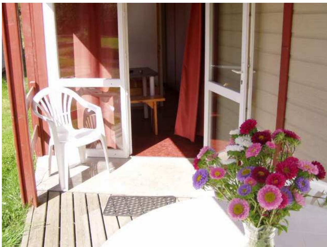
Vues extérieure et intérieure de l'accès au chalet.