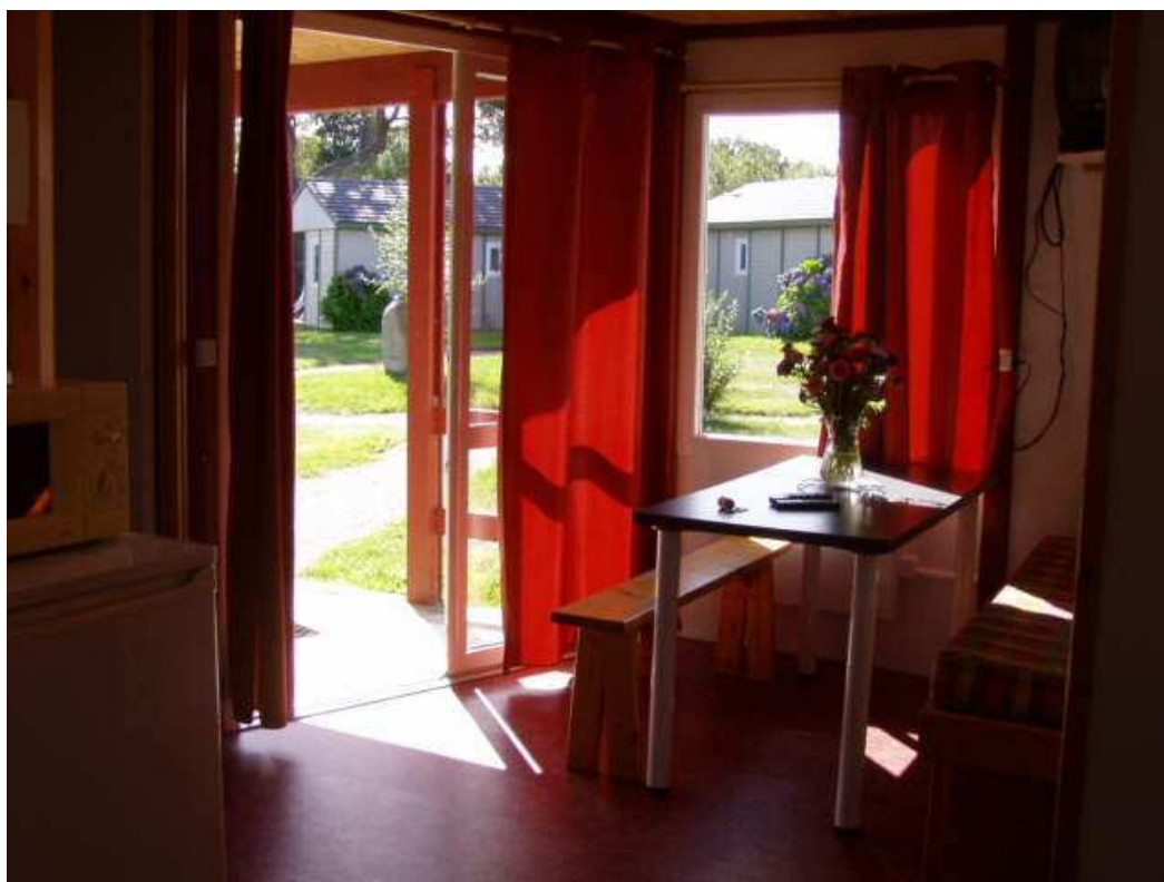
Vues du séjour ; le banc peut être enlevé pour plus de place.