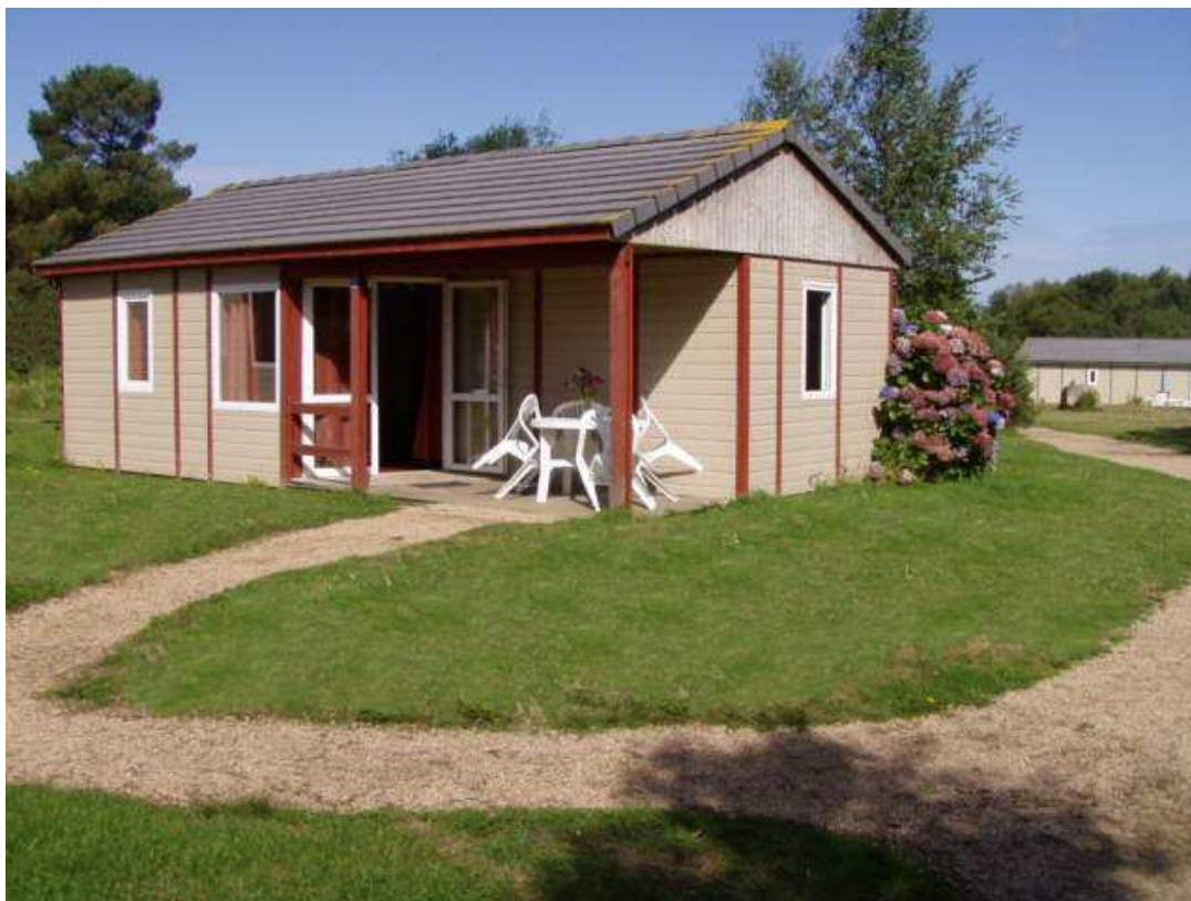
Vue générale d'un chalet adapté aux personnes handicapées.