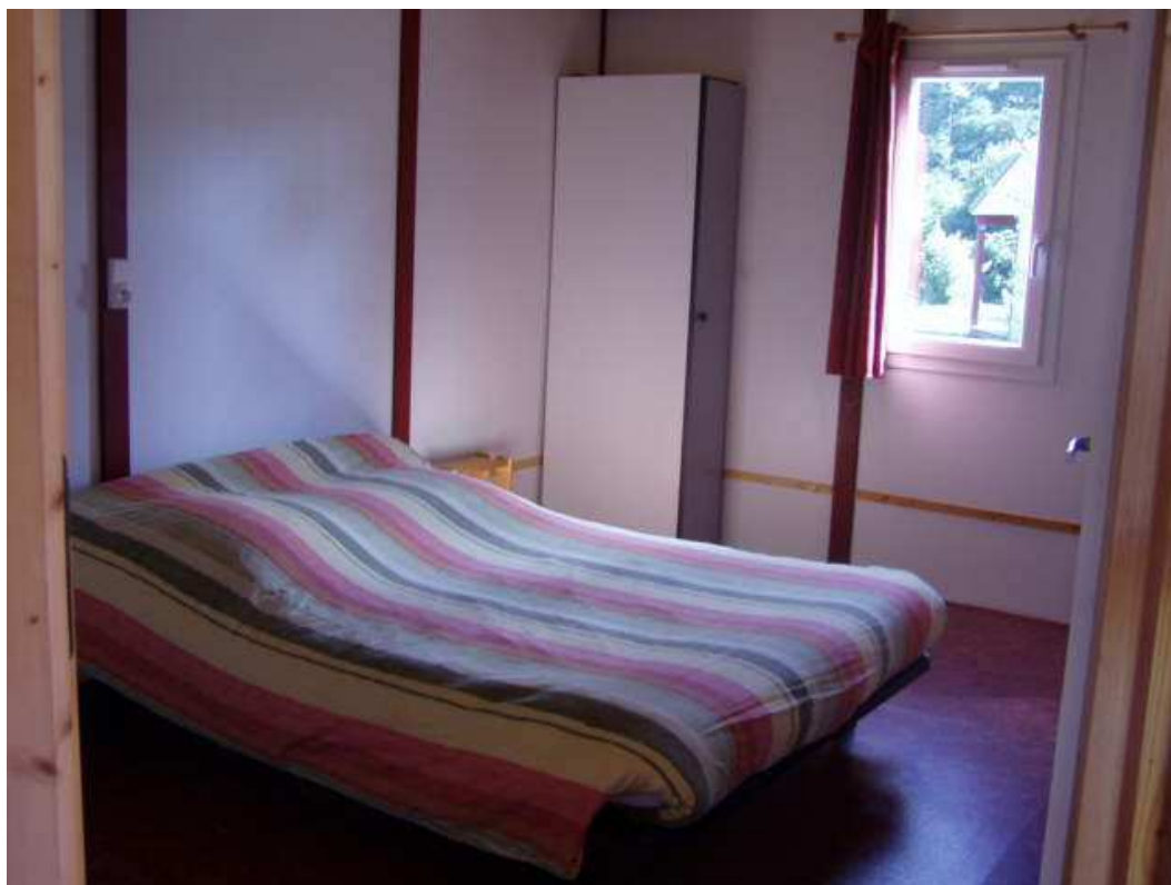
Vues de la chambre accessible à une personne en fauteuil roulant ; le lit peut être rehaussé sur demande. Un lit simple peut encore y être ajouté.