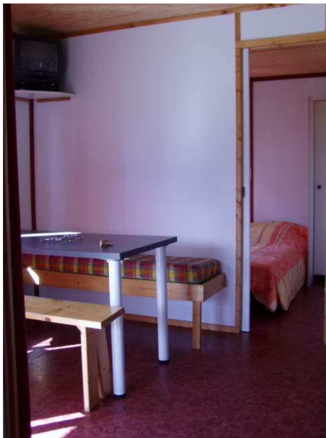
Le coin repas derrière lequel on aperçoit la chambre "enfants" ou "accompagnateurs" (deux lits simples). Cette chambre n'est pas accessible en fauteuil roulant.